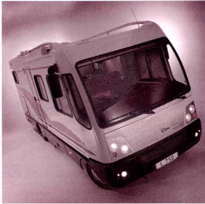
Clou LINER 750