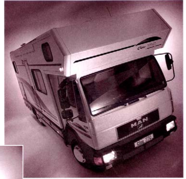
Clou TREND 770