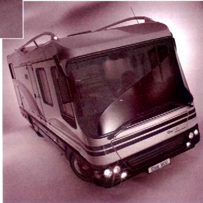
Clou LINER 900