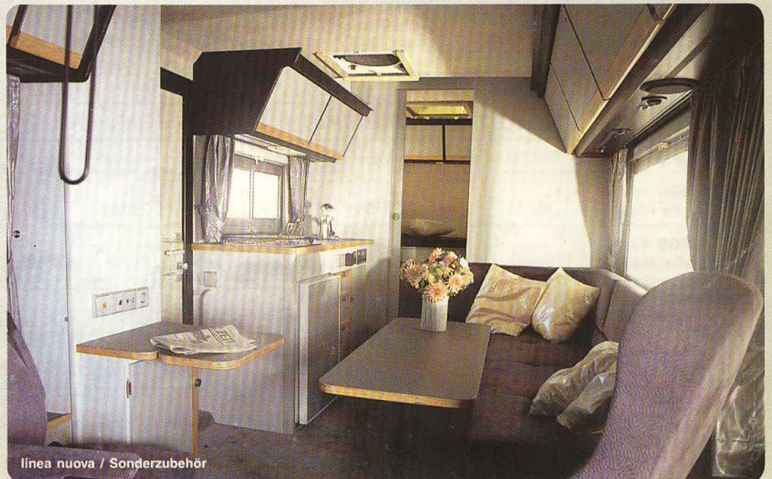
linea nuova / Sonderzubehör

Niesmann D - 5403 Koblenz-Mülheim Industriestraße 12 - 16 Telefon (0261) 287 - 0 Telex 862 546 mcnkg d Telefax (0261) 27766